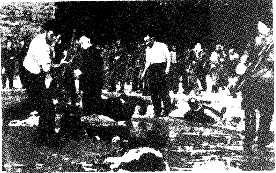
אַט איז דער ספעקטאַקל וואָס די ליטווישע באַנדיטן האָבן איינגעאַרדנט דעם 24-טן יוני 1941 אויף דער לענינסקע פּראָספעקט אין קאַוונע. ליטע 1941.